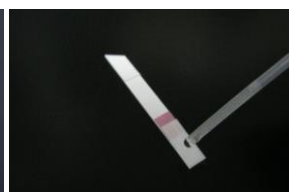
操作 6) チューブ内の懸濁液をスポイトで吸い取り、4滴イムノクロマト試薬のサンプルパッド(角が四角の部位)に滴下する。 (ハウジングケースは必要に応じて使用)