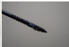
操作 3) ネジを抜き、筋肉組織を採取する。 (おおよそ、10mg～20mg程度の採取が可能)