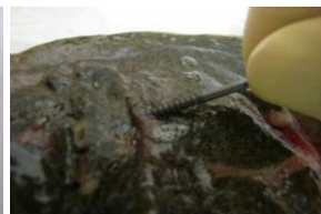
操作 2) ヒラメに対して斜めにネジを刺す。 (頭部側は血管損傷のリスク低い)