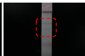
操作 8) 点線の枠内にラインが出現する。 15分後に目視により判定を行う。 (結果判定参照)