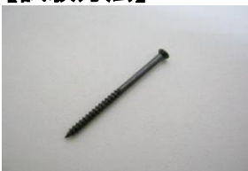
操作 1) サンプリング用のネジを準備する。