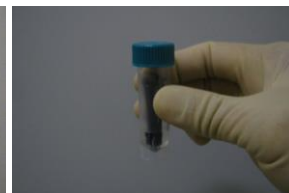
操作 4) 懸濁液の入ったチューブにサンプリングしたネジを最大10本まで入れる。